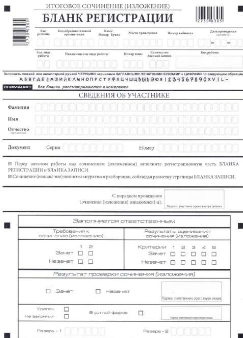
Рис. 1. Бланк регистрации

В верхней части бланка регистрации (рис. 2) расположены: